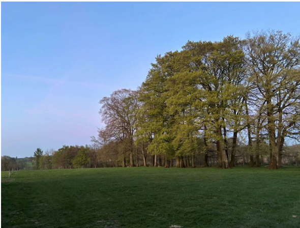
Heeeeel groot speeltrein